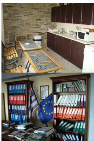
Χώροι του ΚΕΚ ΝΑ ΣΕΡΡΩΝ

Απευθύνεται σε απόφοιτους ΑΕΙ—ΤΕΙ και αποτελεί την προοπτική της ανάπτυξης στην Ελλάδα και την Ευρώπη.