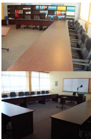
Αίθουσα υλοποίησης προγράμματος Περιβάλλοντος

Το πρόγραμμα ΔΙΑΧΕΙΡΙΣΗ & ΠΡΟΣΤΑΣΙΑ ΠΕΡΙΒΑΛΛΟΝΤΟΣ –ΕΚΤΙΜΗΣΗ ΠΕΡΙΒΑΛΛΟΝΤΙΚΩΝ ΕΠΙΠΤΩΣΕΩΝ