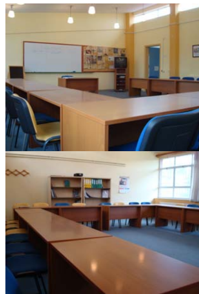
Αίθουσα για το πρόγραμμα Αγροτικών προϊόντων