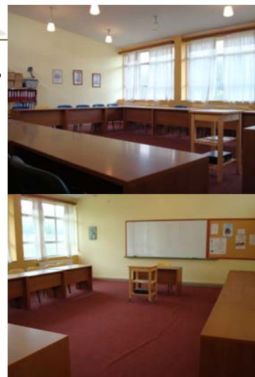
Αίθουσα για το πρόγραμμα της Τηλεθέρμανσης

Το πρόγραμμα της Τηλεθέρμανσης υλοποιείται πρώτη φορά στην Ελλάδα σε συνεργασία με την TECHEM HELLAS .