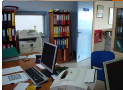
Γραφεία και χώρος φύλαξης παιδιών

Η δομή στο Μελενικίτσι απέχει 11 χλμ από Σέρρες αλλά παρέχει 10 στρέμματα χώρων πρασίνου με άνετο πάρκινγκ.